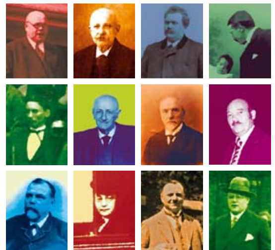
Titelbild des Kalenders

Der Kalender ist ein Ergebnis der Arbeitsgruppe „Stadtteilführer“, die aus engagierten Annener Bürgerinnen und Bürgern, der Freiligrathschule sowie aktiven Institutionen besteht. Die Arbeitsgruppe möchte die Annener Bürgerinnen und Bürger einladen, die vielen Möglichkeiten und Potenziale von Annen kennen zu lernen und in ihren Alltag mit einzubeziehen. Die Arbeitsgruppe erarbeitet Rundgänge, gestaltet Kalender und Karten für den Stadtteil und trifft sich mit interessierten Annener Bürgerinnen und Bürgern in Erzählcafés. Ein besonderer Dank gilt den vielen Annener Bür-