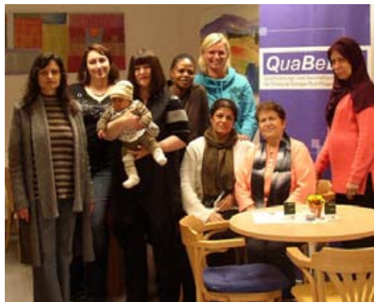
Die „Stadtteilmütter“ von der QuaBeD

„Wir hätten uns damals eine solche Hilfe sehr gewünscht, da wäre uns viel Leid erspart geblieben“ so die ehrenamtlich arbeitenden Stadtteilmütter. Sie nehmen regelmäßig an Qualifizierungsstunden teil und werden geschult in Fragen rund um