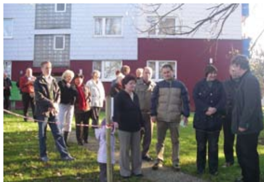
Bewohner der Kerschensteinerstraße diskutieren