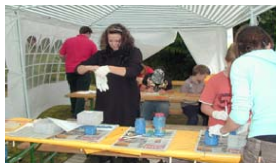
Malen von Steinen auf dem Imbergfest 2008

Ab 2009 sind regelmäßig – jeden letzten Donnerstag im Monat – öffentliche Baustellenbesprechungen geplant, bei denen sich die Annener Bürgerinnen und Bürger über die Bauarbeiten informieren können.