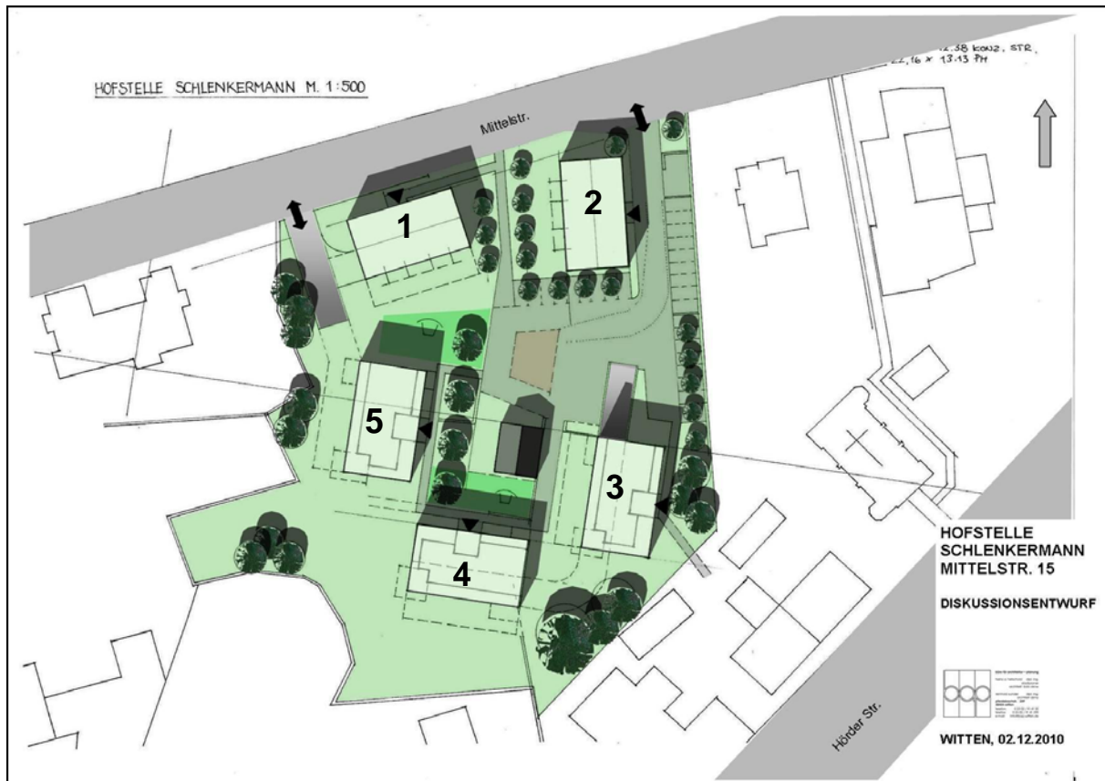
Abbildung 2-1 Lageplan mit Nummerierung der Gebäude

Für die Berechnungen wurden alle Gebäude mit einer Höhe von 8,8 m abgebildet. Die Höhenangaben für die an das Bebauungsgebiet angrenzenden Gebäude wurden den vorliegenden Planunterlagen entnommen und entsprechend abgebildet. Dabei wurde das nach Süden ansteigende Gelände berücksichtigt.